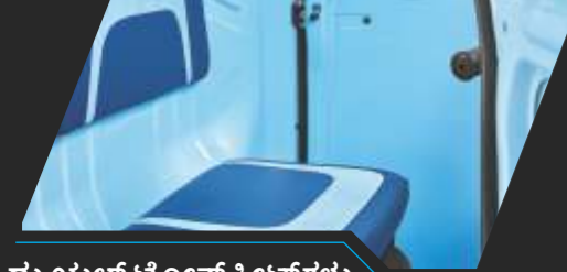
ಡ್ಯುಯಲ್ ಟೋನ್ ಸೀಟ್‌ಗಳು