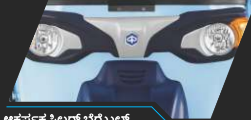
ಆಕರ್ಷಕ ಸಿಲ್ವರ್ ಬೆರ್ಮುಲ್